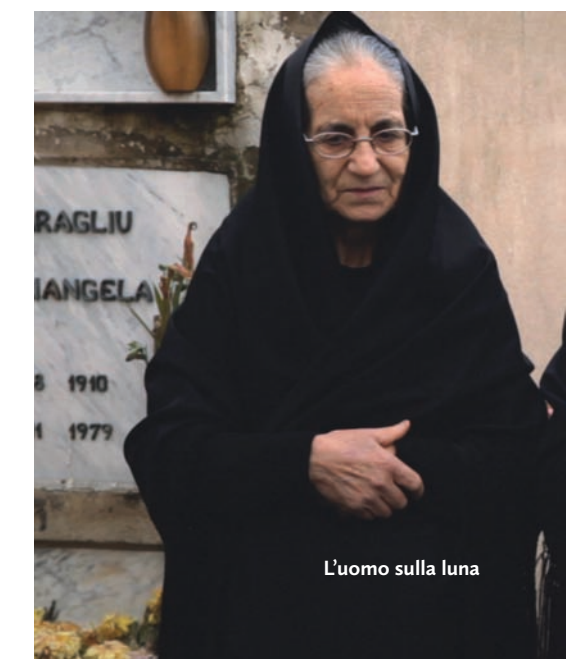
L'uomo sulla luna