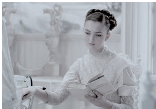
Erwin Olaf, Dawn