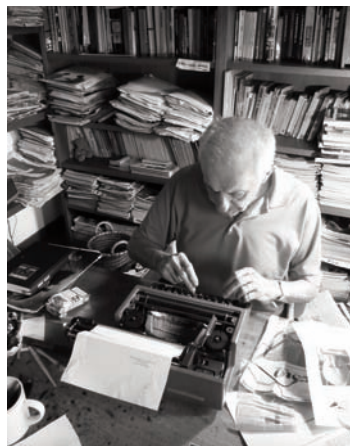
Daniele Segre, Je m'appelle Morando , Alfabeto Morandini

Je m'appelle Morando. Alfabeto Morandini , Daniele Segre, Italia, 2010, 53'